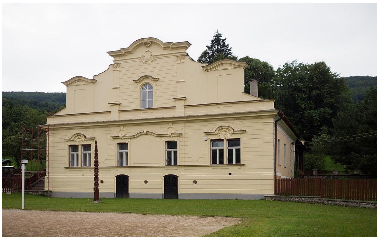
Kaštieľ neobarokový, prestavaný koncom 19. Storočia, pochádzajúci z 2. Polovice 18. storočia