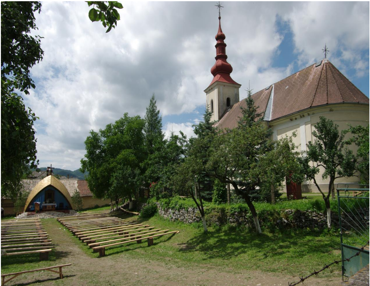
Kostol Karmel'skej P. Márie katolícky, prestavaný v roku 1672, ktorý pochádzal z roku 1428,

Rímskokatolícky kostol Panny Márie Karmelskej, jednodňová neskorobaroková stavba so segmentovým ukončením presbytéria a vežou tvoriacou súčasť jej hmoty z roku 1759. Vznikol na mieste stredovekej stavby z roku 1482. Kostol prešiel úpravami v roku 1896. Na hlavnom klasicistickom oltári sa nachádza starší barokový obraz Panny Márie zo začiatku 18. storočia. Fasády kostola sú členené lizénami a polkruhovo ukončenými oknami. Veža vystupujúca z priečelia vo forme rizalitu, je lemovaná lizénami a ukončená barokovou helmicou s laternou. Najstarší z troch zvonov v kostole pochádza z roku 1635