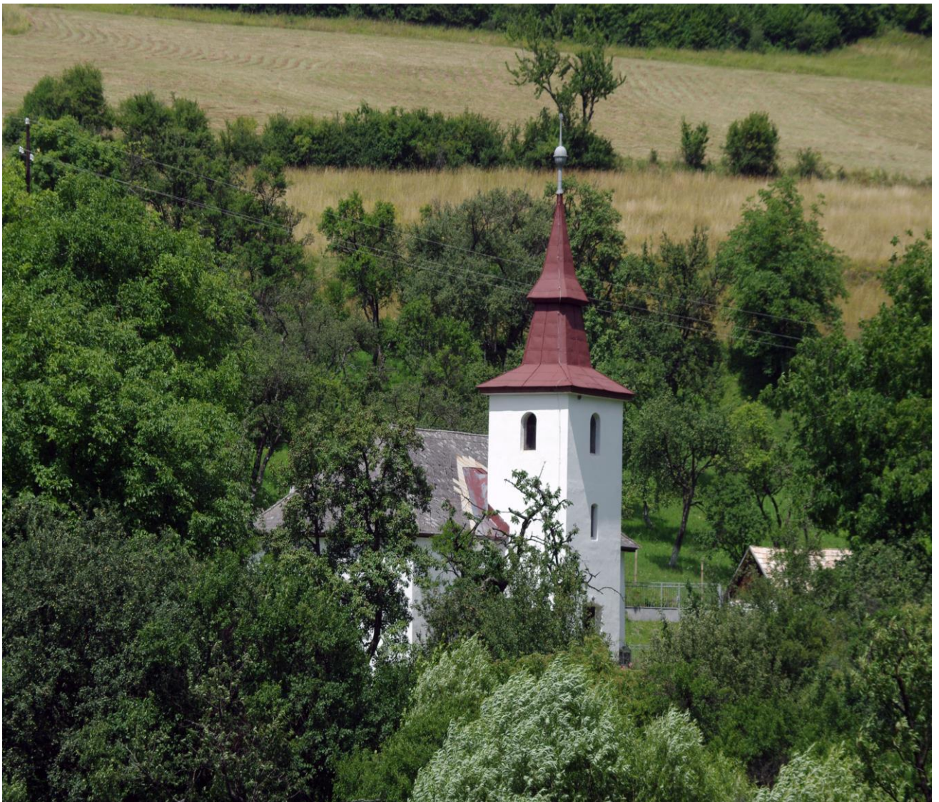
Kostol Reformovaný postavený po roku 1794 a dokončený vežou r. 1804.

Reformovaný kostol, jednolod'ová klasicistická stavba s pravouhlým záverom a predstavanou vežou z roku 1794. Interiér je zaklenutý zrkadlovou klenbou. Veža bola ku kostolu pristavaná v roku 1804. Fasády kostola sú hladké bielené. Veža s polkruhovo ukončenými rezonančnými otvormi je ukončená ihlancovou helmicou. Kostol má dva zvony, starší z roku 1793 a mladší z roku 1929